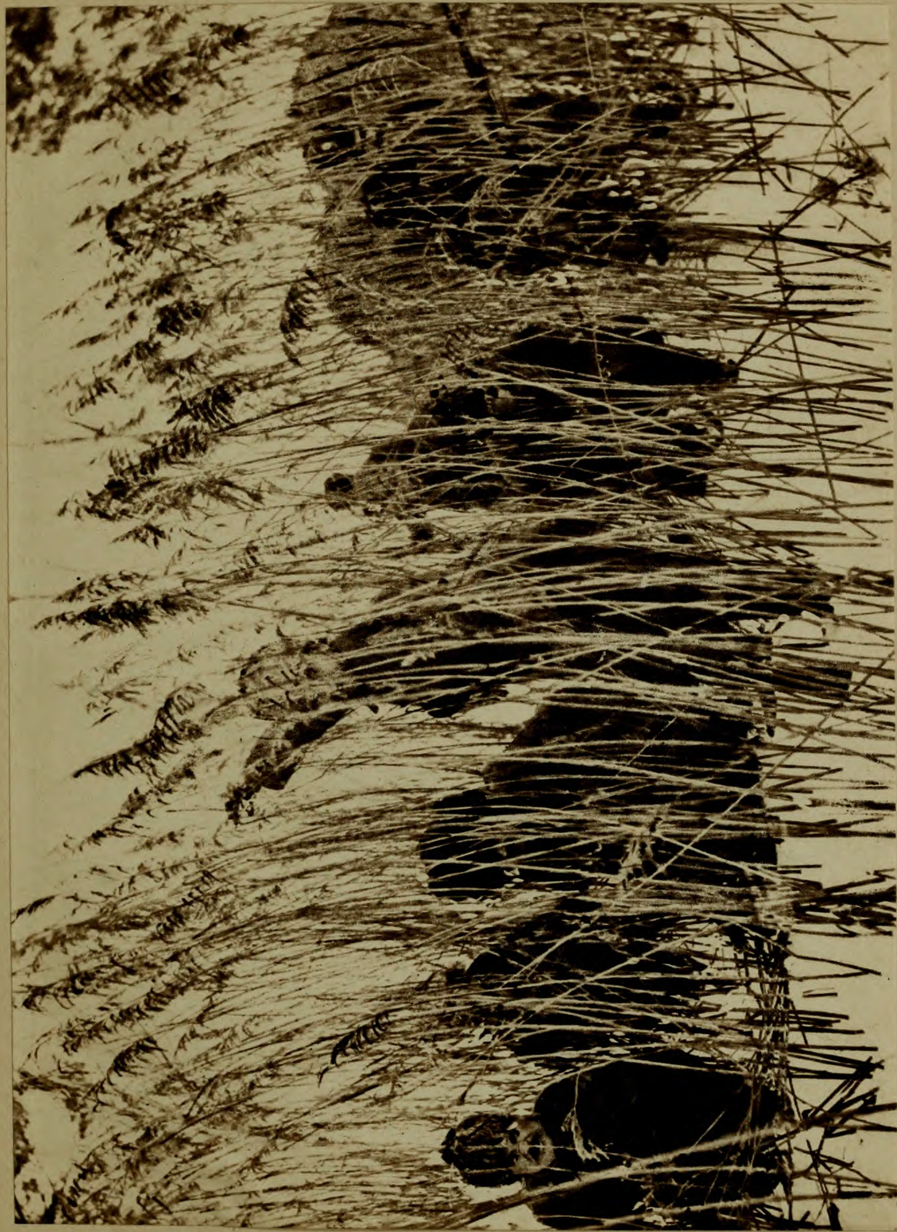
ПЕРЕДЪ АТАКОЙ ВЪ КАМЫШАХЪ ЗИМОЙ.